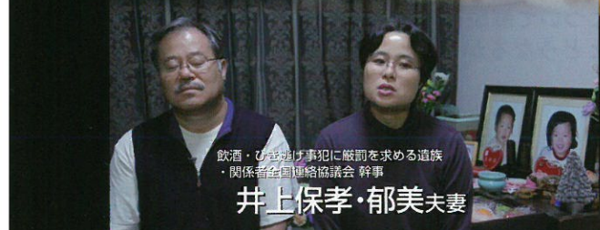
飲酒・ひき逃げ事犯に厳罰を求める遺族 関係者全国連絡協議会 幹事