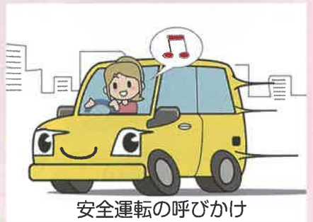
安全運転の呼びかけ