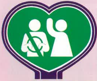
山口県交通安全 シンボルマーク