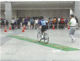
技能走行 (デコボコ道走行)