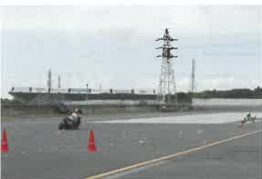
技能走行 (コンビスラ)

輪及び大型二輪の各クラスに出場した各選手は日頃の練習の成果を遺憾なく発揮し、団体16位の成績を収めました。選手の皆さん、大変お疲れ様でした。