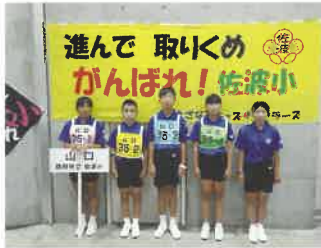
さざなみキッズサイクラーズ