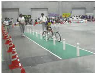
技能走行 (ジグザグ走行)