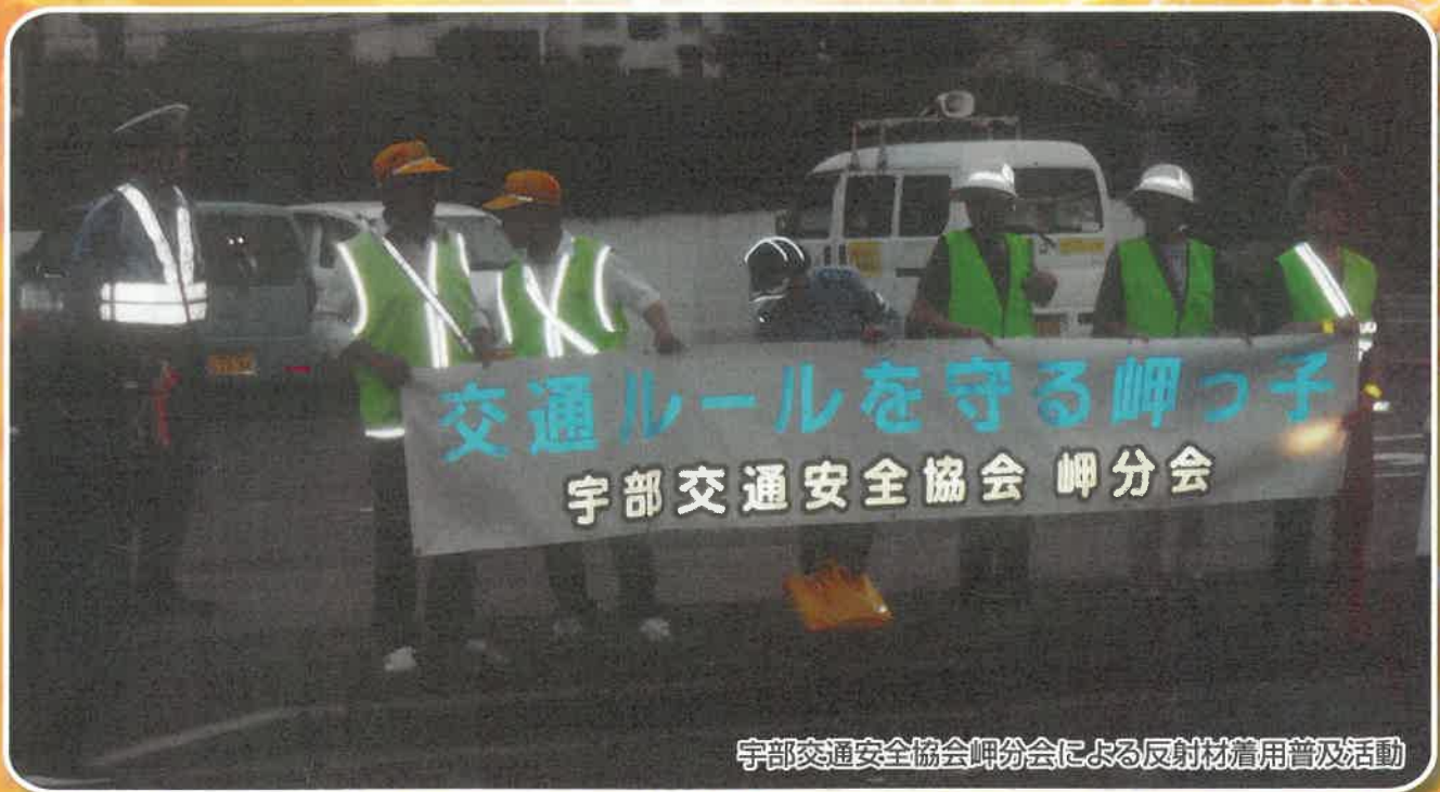
宇部交通安全協会岬分会による反射材着用普及活動