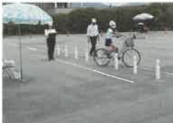
技能走行 (ジグザグ走行)