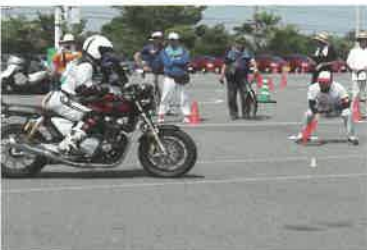
技能走行 (極小バランス)