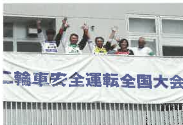
出場した山口県選手団