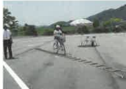
技能走行 (デコボコ道走行)