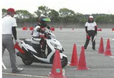
技能走行 (応用千鳥)