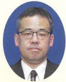
山口県警察本部長 片倉 秀樹