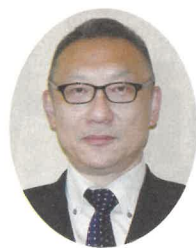
山口県警察本部長