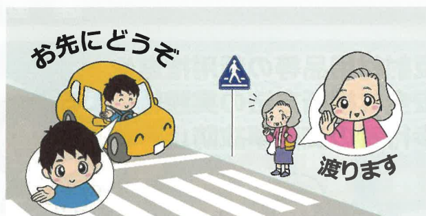
横断歩道ハンドサイン運動実施中